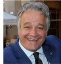
Gianni Tonelli, ex deputato Lega

«La sentenza, invece - conclude il sindacalista - chiarisce che le censure erano infondate, e possiamo dire pretestuose e intimidatorie, poiché era evidente che stessi indossando una maglietta del Sap in quanto sulle spalle era in bella evidenza la scritta 'I love polizia' e sulla parte anteriore vi erano diverse spille e patch con il logo Sap».