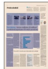
Peso: 1-1%, 14-49%