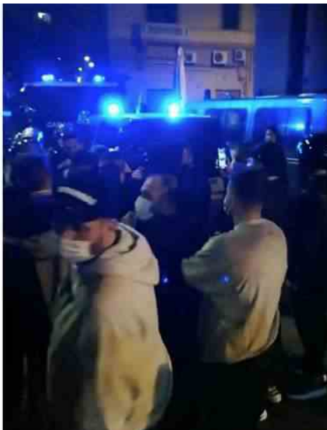
I disordini avvenuti ieri sera a Napoli

“Quello che è successo ieri sera a Napoli – dichiara il sindacato di Polizia Sap – è l’ulteriore fatto gravissimo dopo quelli accaduti recentemente a Savona e a Livorno.