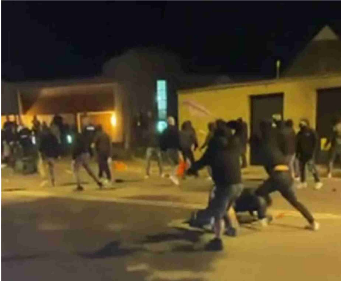
Un momento dei violenti scontri al termine della partita di basket tra Trieste e Varese di domenica scorsa