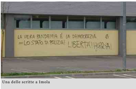
Una delle scritte a Imola

Publicato il: 22/03/2020 18:56 (di Silvia Mancinelli ) - "La vera pandemia è la Polizia" e ancora "la vera pandemia è la democrazia = lo stato di polizia! Libertà". E poi "Esci di casa, brucia la divisa". Dopo l'augurio scritto su un muro della zona Corvetto di Milano perché il coronavirus ammazzasse "gli sbirri"