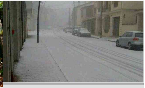
Bufera di neve sul Gennargentu, fiocchi fino a 500 metri: strade ghiacciate

Copyright © 2018 YouTG.NET. Tutti i diritti riservati.