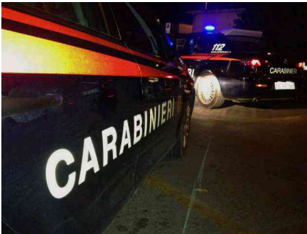
Cagliari, disordini in piazza Matteotti fra cagliaritari e stranieri: giovane si scaglia contro i carabinieri