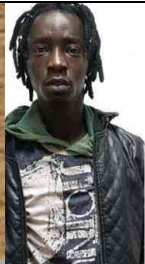
Il gambiano col vizio dello spaccio: arrestato alla Marina per l'ennesima volta