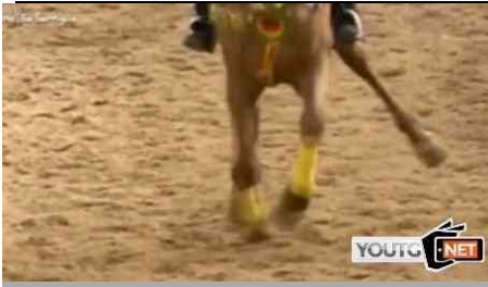
La zampa è rotta ma il cavallo corre verso la stella alla Sartiglia: rabbia animalista