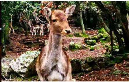
"Non uccideteli, dateli a noi": da Monte Arci l'appello per i daini nel mirino a Porto Conte