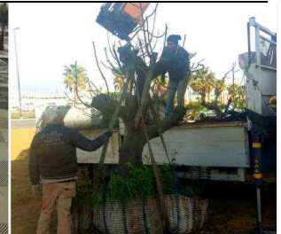
Sant'Elia, già rubate le piante dell'orto condiviso del Comune: erano lì da tre giorni