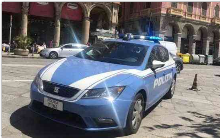
Polizia a Cagliari

Centoventi poliziotti in meno, per un organico ridotto in sei anni del 30%.