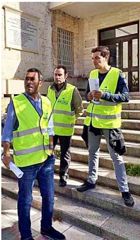
"Nonostante abbiamo apprezzato lo sforzo economico compiuto dall'esecutivo, non possiamo non

Autore: Alessandro Congia il 30/03/2017 13:03