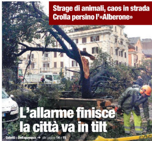
Strage di animali, caos in strada Crolla persino l'«Alberone»