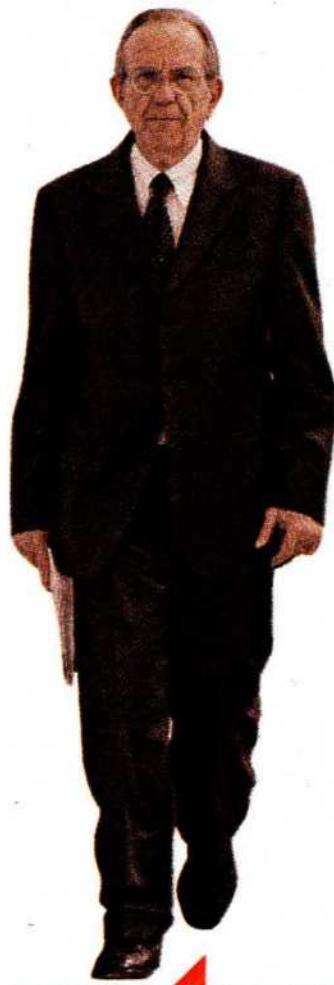
AL TIMONE Il ministro dell'Economia, Pier Carlo Padoan