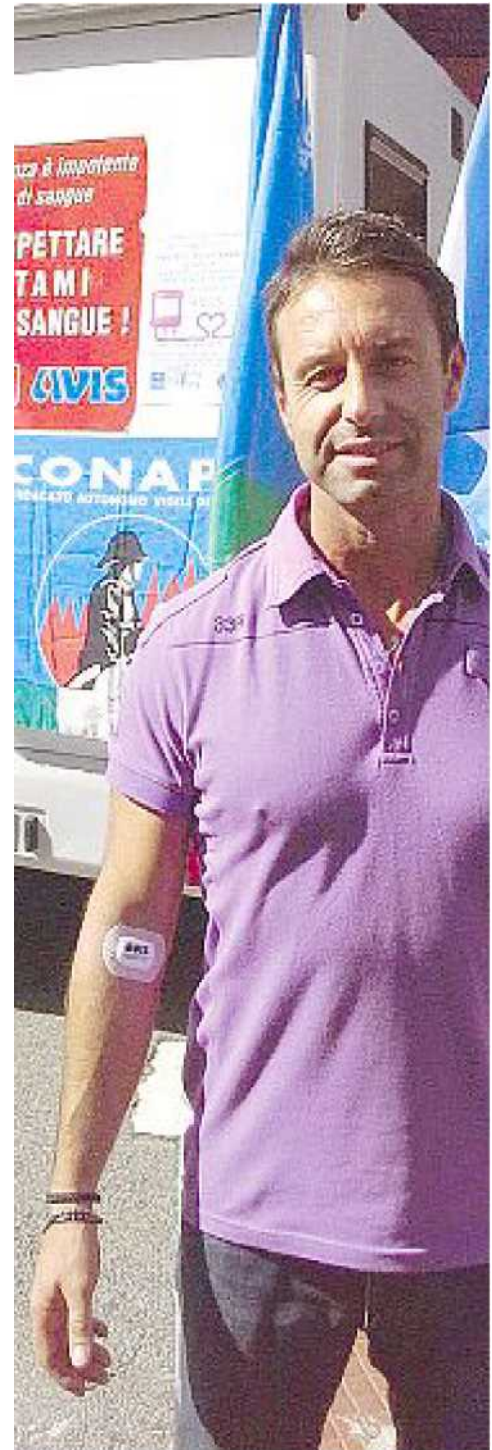
IL SIMBOLO DELLA PROTESTA Un operatore della sicurezza mostra il segno del prelievo di sangue a cui si è sottoposto